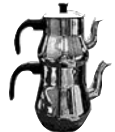
Plus pratique et moins chère que le samover : la çaydanlık, théière à deux étages.

Les commerçants ont constaté que beaucoup de touristes répugnaient à boire du thé à longueur de journée, et n'en donnaient pas aux enfants. Ils ont inventé un ersatz, baptisé thé aux pommes, qui est une sorte de décoction de ce fruit, servi chaude dans des verres à thé. On reconnaît aisément le soi-disant thé aux pommes par sa couleur jaune caractéristique qui est différente de celle, rouge, du thé. On vous proposera parfois une boisson chaude à l'orange nommée Oralet , de la marque qui commercialisa la première le breuvage.