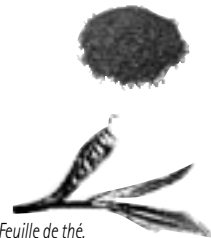
Feuille de thé.