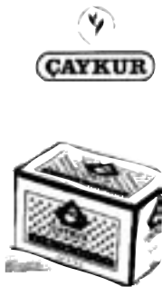
Çaykur : le thé en sachet fait des percées sur le marché turc.

Ne vous y trompez pas, plus le thé est infusé dans la théière moins il est fort, car l'infusion très longue de feuilles de thé produit du tanin, qui dissout la caféine contenue dans le thé. Ainsi les feuilles de thé étant maintenues longtemps, le breuvage devient de plus en plus léger en excitant, même si le taux de tanin âpre au goût donne l'impression contraire. Ce qui permet d'en boire, comme font les Turcs, tout au long de la journée.