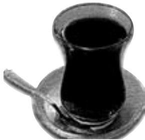
Le célèbre verre à thé de forme de tulipe.

Le thé consommé en Turquie est de couleur rougeâtre, et provient du nord du pays, le long de la Mer noire. Il est bu dans de petits verres à la forme caractéristique : les verres tulipe.