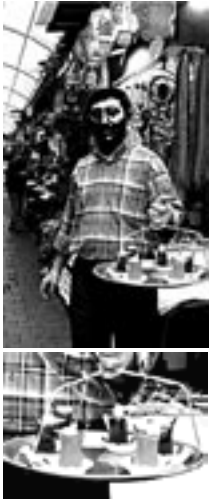
Sur le plateau, deux sortes de thés : brun, le thé normal, et thé à la pomme.